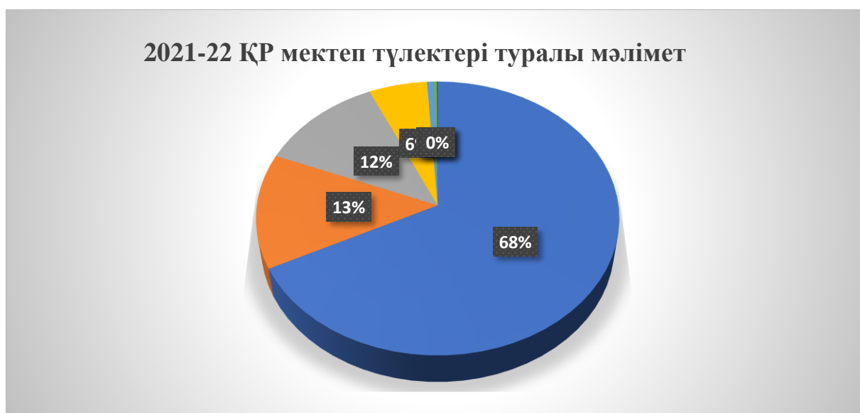
1-сурет - 2021-22 ҚР мектеп түлектері туралы мәлімет

ОӨК - да оқушылар қызығушылықтарына, бейімділіктеріне, медициналық-физиологиялық көрсеткіштеріне сәйкес экономикалық білімнің, кәсіби бағдарлаудың негіздерін қалыптастырады, нарық жағдайында еңбекке саналы көзқарас қалыптасады, мамандыққа деген қызығушылық, техникалық шығармашылық, тапқырлық және рационализаторлық дамиды және бекітіледі. Өндірістік қызмет мемлекеттік және жеке меншік нысанындағы кәсіпорындармен ынтымақтастық кезінде шарттық негізде ұйымдастырылады. Оқу аяқталғаннан кейін ОӨК-да Министрдің бұйрығына сәйкес мамандық бойынша біліктілік емтихандары форматында қорытынды аттестаттау өткізіледі. Елімізде мамандық таңдауға дайындықты 23 мыңнан астам адам оқитын 28 ОӨК жүзеге асырады. ОӨК-ның ең көп саны Алматы облысында жұмыс істейді, онда 13 КТК негізінде 159 оқытушы мен шебер жыл сайын 9 кәсіптер бойынша оқытады.