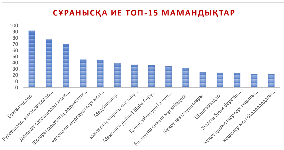
3-сурет - Сұранысқа ие ТОП-15 мамандықтар

Кәсіптік бағдар беру кеңесшілері колледждермен және университеттермен, өңірлердің кәсіпорындарымен және ұйымдарымен ынтымақтастық негізінде жоғары сынып оқушыларына кәсіптік бағдар берудің басқа да түрлерін жүзеге асыруда.