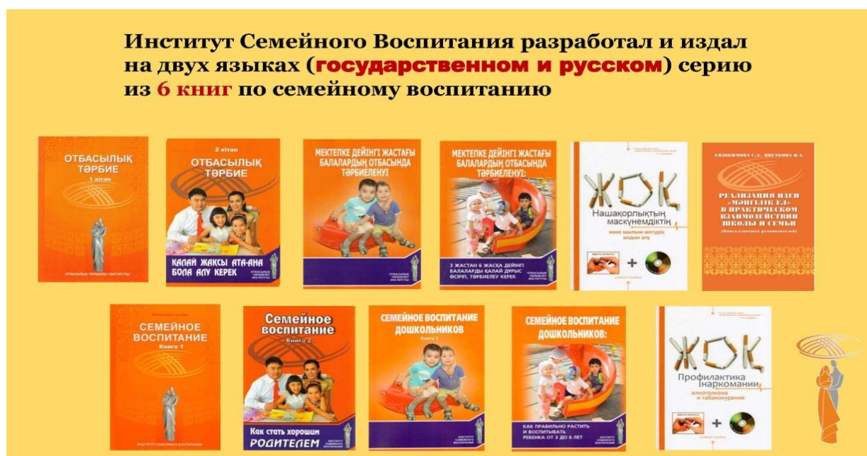
1-сурет. Республикалық «Отбасылық тәрбие» ғылыми-практикалық журналы

Отбасылық тәрбиелеу институты. Отбасылық тәрбиелеу институты отбасылық тәрбиеге байланысты екі тілде журнал (1-сурет) шығарады.