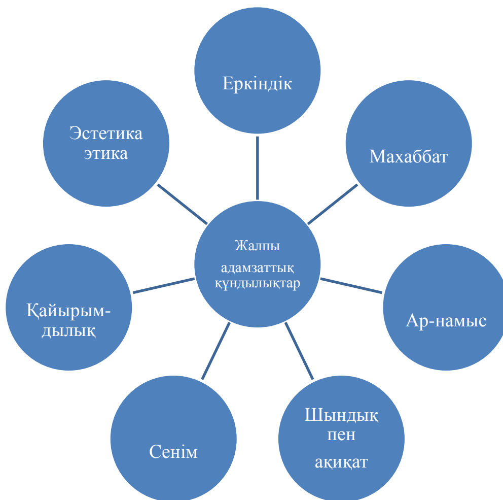
1-сызба. Жалпы адамзаттық құндылықтар [25].

Бұл жалпыадамзаттық құндылықтар тәрбиенің Тұжырымдамалық сегіз бағытына топтастырылған (1-сызба).