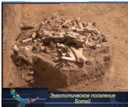
Энеолитическое поселение Ботай

Қазақстанның қасиетті жерлерінің мәдени-географиялық белдеуі - неше