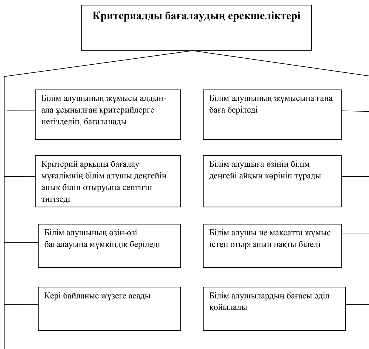
1-сызба. Критериалды бағалаудың ерекшеліктері

Жаңартылған білім мазмұны бойынша критериалды бағалаудың ерекшеліктері 1-сызбада көрсетілген.