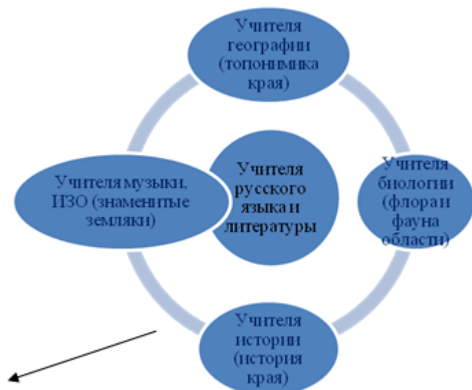
Схема 1. Межпредметная интеграция

Опыт работы по литературному краеведению с точки зрения практика Т.В. Ситниковой [7] можно представить как технологию интегрального взаимодействия на уровне предметов, каждый из которых имеет свои объекты для изучения края. Это дает комплексную картину регионального компонента.