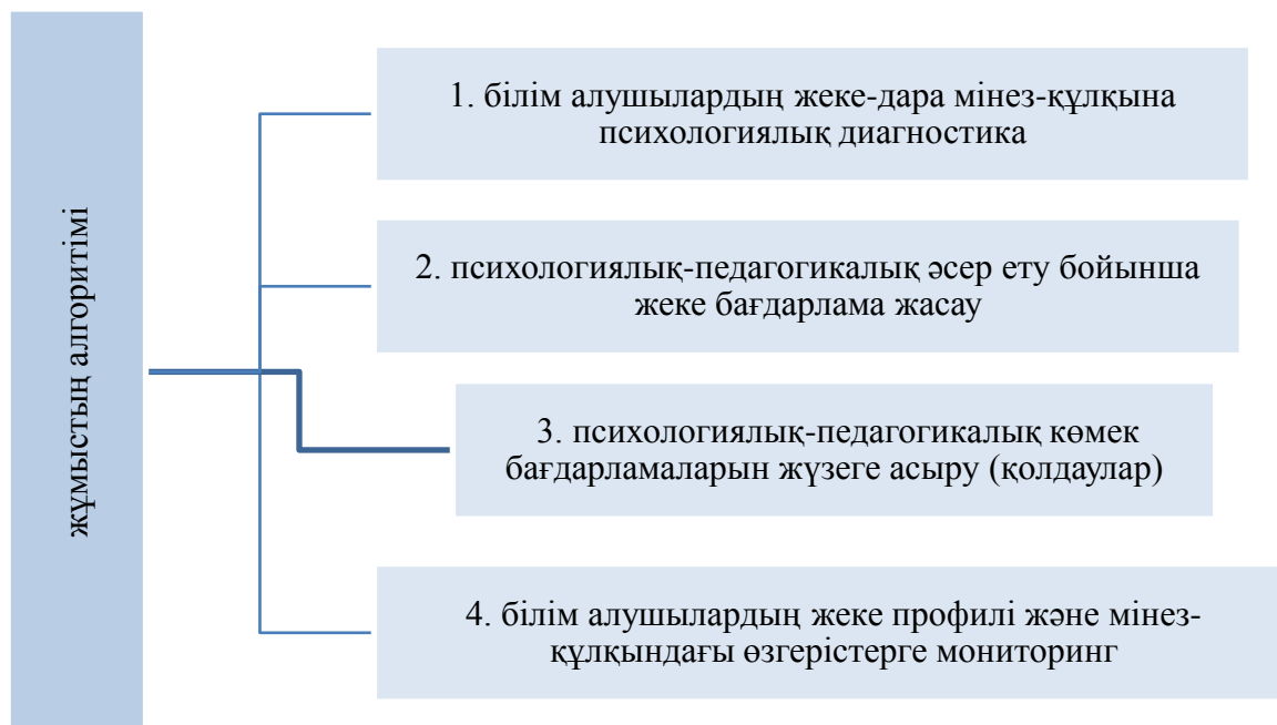
1-сурет – Білім алушыларда дезадаптациялық жағдайлардың алдын алу шаралары

Білім алушылардағы дезадаптациялық жағдайлардың алдын алу шаралары бойынша нақты алгоритм бар, оның құрамы келесі негізгі сатылардвн тұрады (сурет 1) [7]: