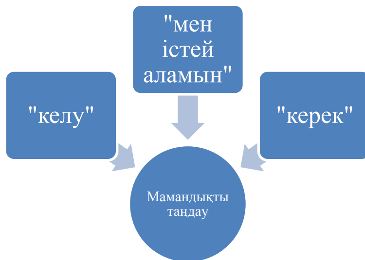
1-сурет. Мамандықты саналы таңдау үшін бағдарлар

Қазіргі мектепте жалпы білім беру процесін ұйымдастыруда білім алушылармен кәсіптік бағдарлау маңызды орын алады, өйткені ол білім беру жүйесін еңбек нарығымен және қоғамның мамандықтарға деген қажеттіліктерімен, ал студенттердің жеке мүдделері мен қажеттіліктерін олардың болашағымен байланыстырады. Жасөспірім дұрыс таңдау жасауы үшін оны диагностикалау және белгілі бір мамандық туралы айту жеткіліксіз. Ол бұл оның мүмкіндіктеріне, қабілеттері мен ұмтылыстарына сәйкес келетін барлық мүмкін болатын ең жақсы таңдау екеніне сенімді болуы керек. Қоғамның әлауқаты үшін мектептің әр түлегі өзінің мүдделерін, бейімділіктерін, қабілеттерін неғұрлым толық қолдана білуі керек, өз кәсібін іздеуде уақытты, күш-жігерді (және құралдарды) ысырап етпеуі керек, мұнда ол үлкен пайда әкеліп, өз жұмысынан терең қанағат ала алады.