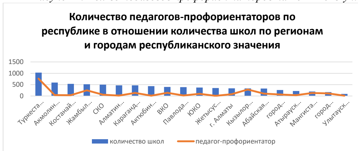
Рисунок 1. Кол-во педагогов профориентаторов на 2022-2023 уч.год