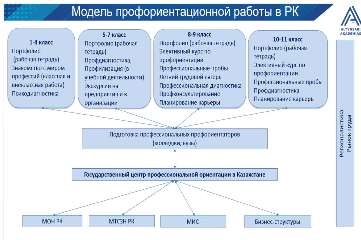
Рисунок 2. Модель профориентационной работы в РК