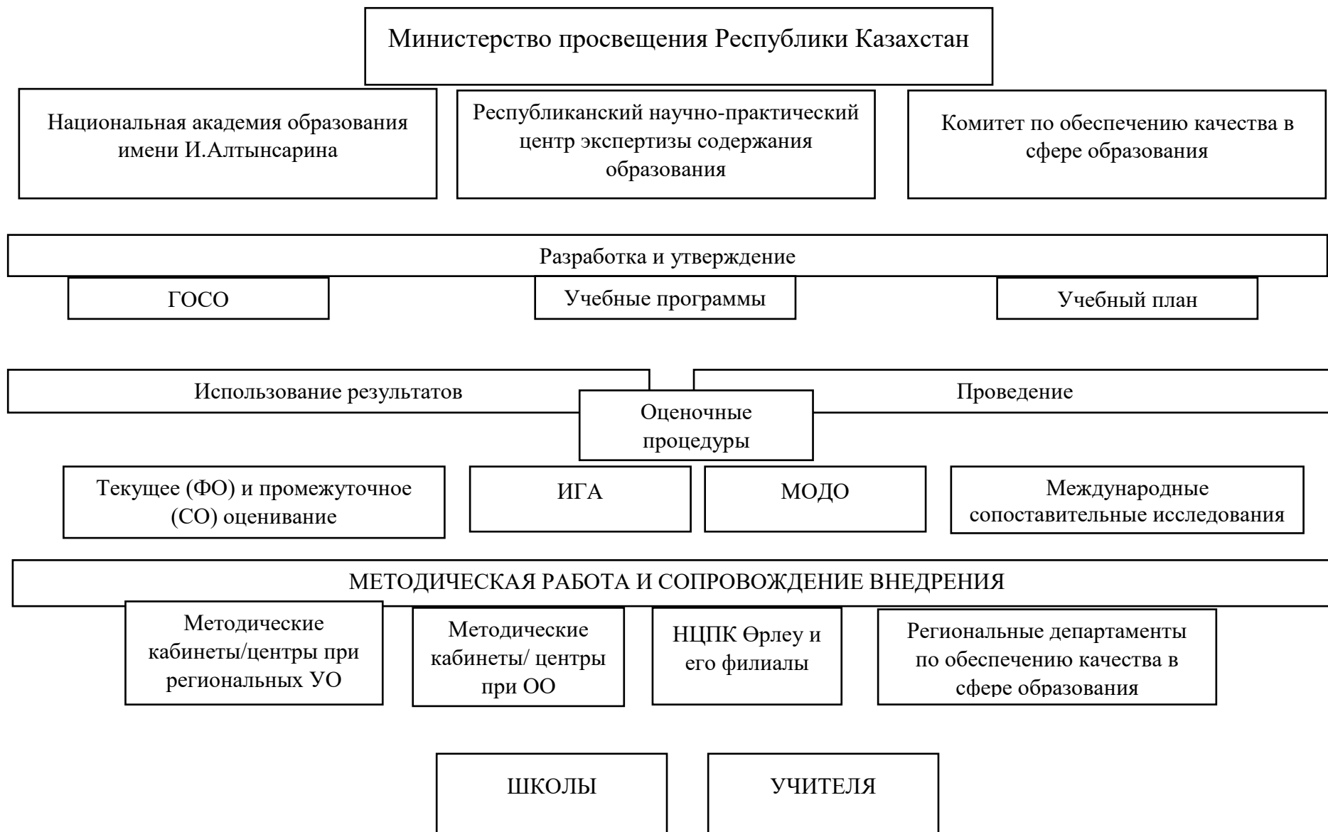
Рисунок 1. Система научно-методического сопровождения ГОСО