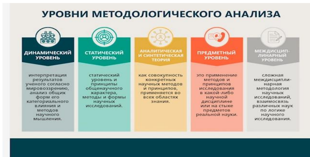
Рисунок 1 – Уровни методологического анализа

Методология – это исследование методов, форм и принципов создания научных знаний и структур истины (А.М. Болтаева). Это изучение структуры, логики, организации, методов и инструментов науки, ее теории и практики в различных областях. Методология - как учение об основах познания, анализирует и оценивает философско-мировоззренческие позиции исследователя, основанные на процессе научного познания.