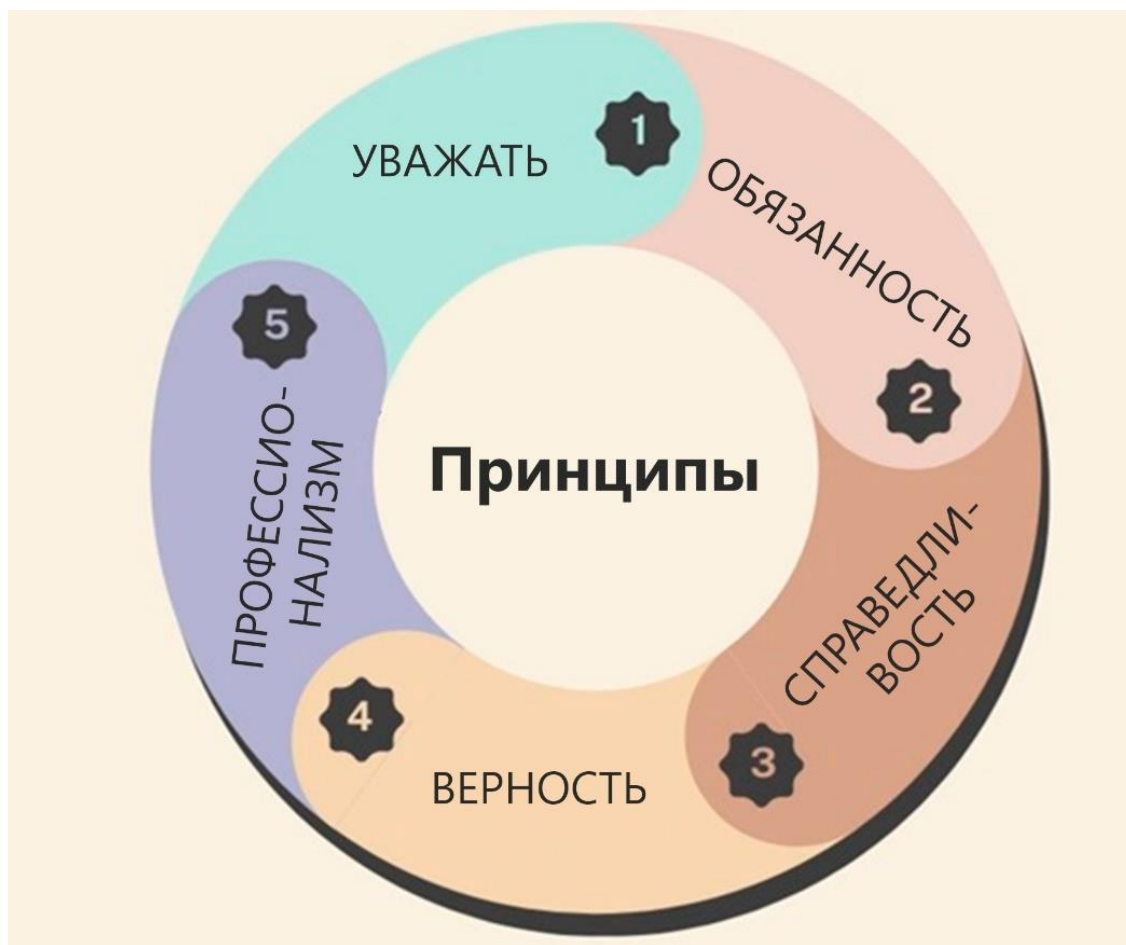
Рисунок 4 – Принципы, которые важно придерживаться исследователю при организации и проведении научно-исследовательской работы [8,9]

высшего образования Назарбаев Университета руководствовалась «Основным руководством по проведению исследовательского проекта» О’Лири Зина [8].