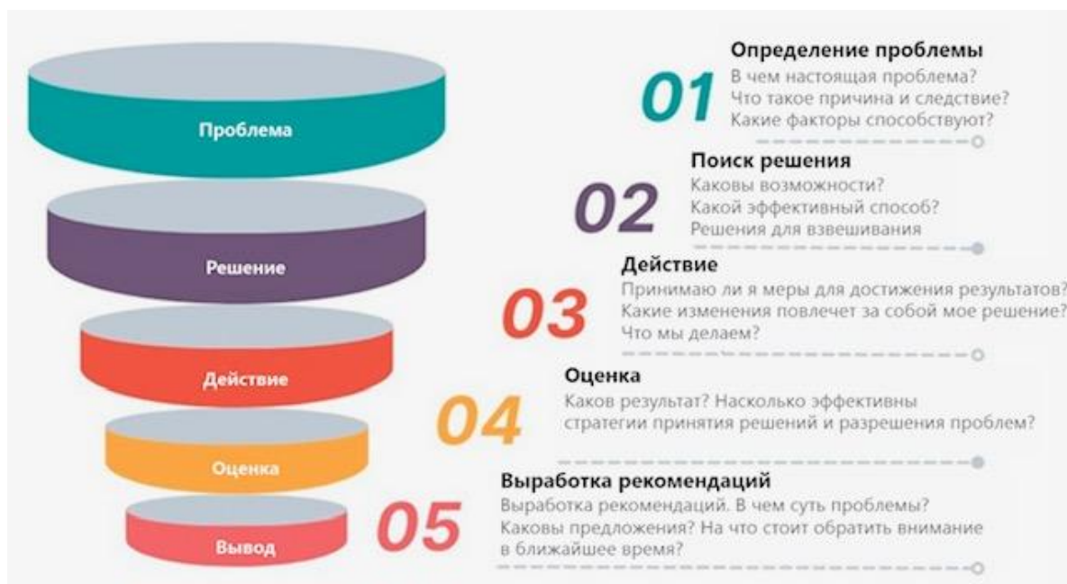
Рисунок 2 – Алгоритм ориентации научно-исследовательской работы на результат

Методология - как изучение методов и приемов научного исследования - учитывает важные характеристики конкретных методов познания, составляющих общее направление исследования. К таким методам следует отнести подходы и методы на этапах теоретического и эмпирического исследования [2].