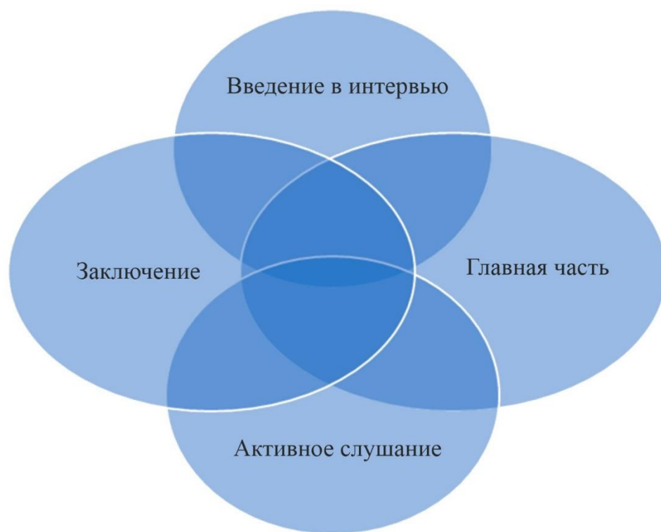
Рисунок 5 – Интервьюирование

Давайте поговорим подробнее об интервью: