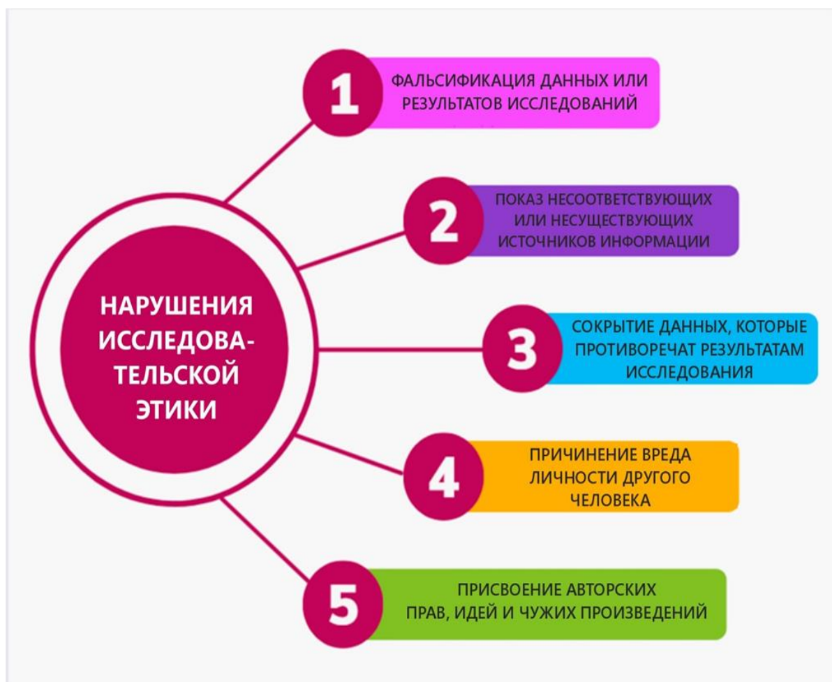
Рисунок 6 – Нарушения исследовательской деятельности

Какие условия влекут нарушения исследовательской этики?