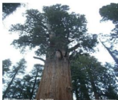
3- сурете. Бәйтерек

2-мәтін. Тақырыпты айтпас бұрын мына екі суретке назар аудар: