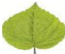
4- сурет. Жапырақ.