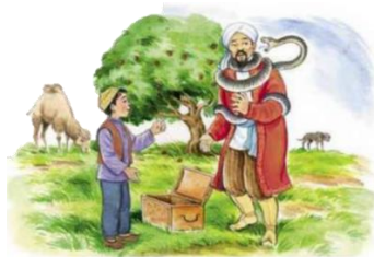
1- сурет. «Бір әлім мен жыланның кездесуі»

Алдымен, болжап оқу стратегиясына тоқталайық. Бұл стратегияны қолдана отырып, бала мәтінді оқығанға дейін онда не туралы айтылатынын мәтіннің тақырыбына немесе ұсынылған суретке назар аудара отырып болжай алады. Мысалы, төмендегі суретке қарап, бүгін танысатын әңгімелеріңіз не туралы болатынын болжау.