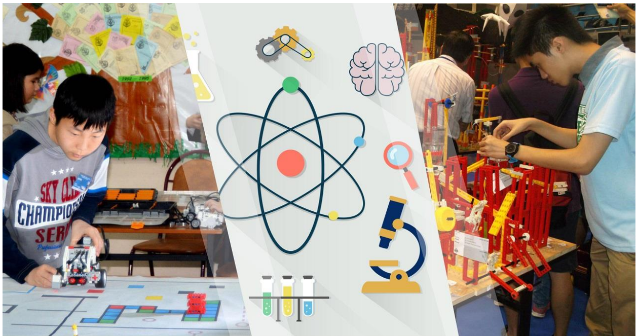
Оқушылар Стем сабақтарында